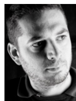
di Andrea Lupini

zioni che seguono la distillazione: Giovane (non invecchiata); Aromatica (derivante da uve aromatiche quali Moscato o Traminer aromatico); Invecchiata (minimo 12 mesi d'invecchiamento in legno sotto controllo UTF, oggi Agenzia delle Dogane); Riserva Invecchiata o Stravecchia (minimo 18 mesi d'invecchiamento in legno sotto controllo UTF); Aromatizzata (con aggiunta di aromatizzanti naturali come erbe, radici o frutti) o parte di esse.